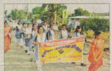
सीहोर । मतदान जगरूकता के लिए रैली निकालती छत्राएं।

रैली के दौरान महिला मतद्यताओं को उनके मताधिकार का महत्व बताते हुए समझाया गया कि उनका एक-एक बोट निर्णायक होता है। इसलिए सभी भतदाताओं