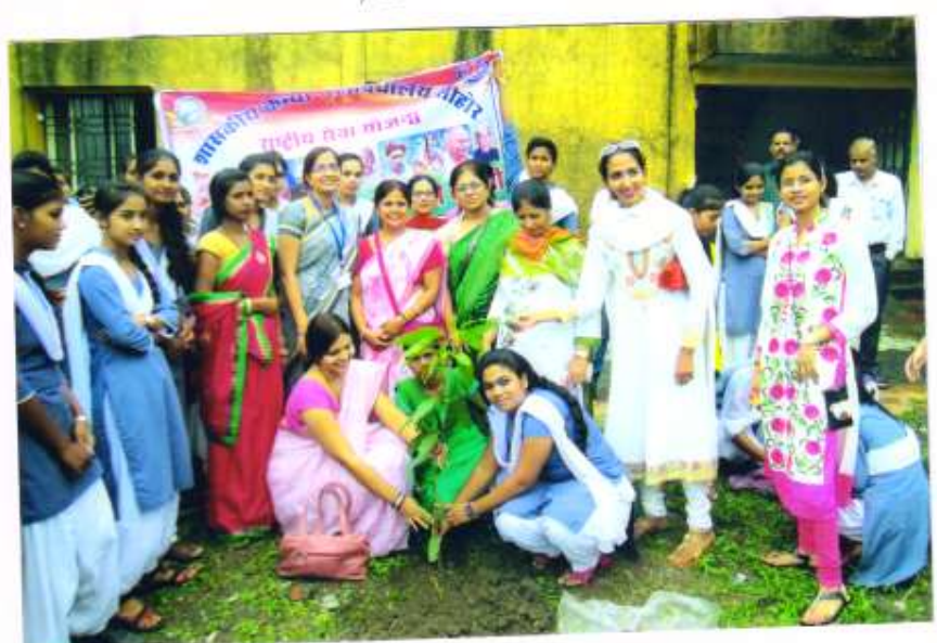
र-वतंत्रता रिवस पर् श्रूथारोपण