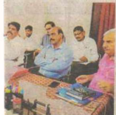
कैडेटों में उपरिष्ठत अधिकांशों का जन्म उत्सव।

कैडेटों में उपरिष्ठत अधिकांशों का जन्म उत्सव। कैडेटों में उपरिष्ठत अधिकांशों का जन्म उत्सव। कैडेटों में उपरिष्ठत अधिकांशों का जन्म उत्सव। कैडेटों में उपरिष्ठत अधिकांशों का जन्म उत्सव। कैडेटों में उपरिष्ठत अधिकांशों का जन्म उत्सव।