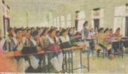
सीहोर, आंगनबाड़ीकरण कार्यक्रम में उपरिष्ठत अधिकांशों का जन्म उत्सव।

सीहोर में कॉलेज में नवप्रवेशित छात्राओं का तिलक लगाकर स्वागत किया गया। आंगनबाड़ी में नवप्रवेशित छात्राओं का तिलक लगाकर स्वागत किया गया। आंगनबाड़ी में नवप्रवेशित छात्राओं का तिलक लगाकर स्वागत किया गया।